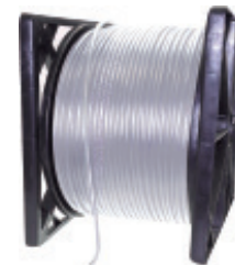
Bobina 305 y 500 mts